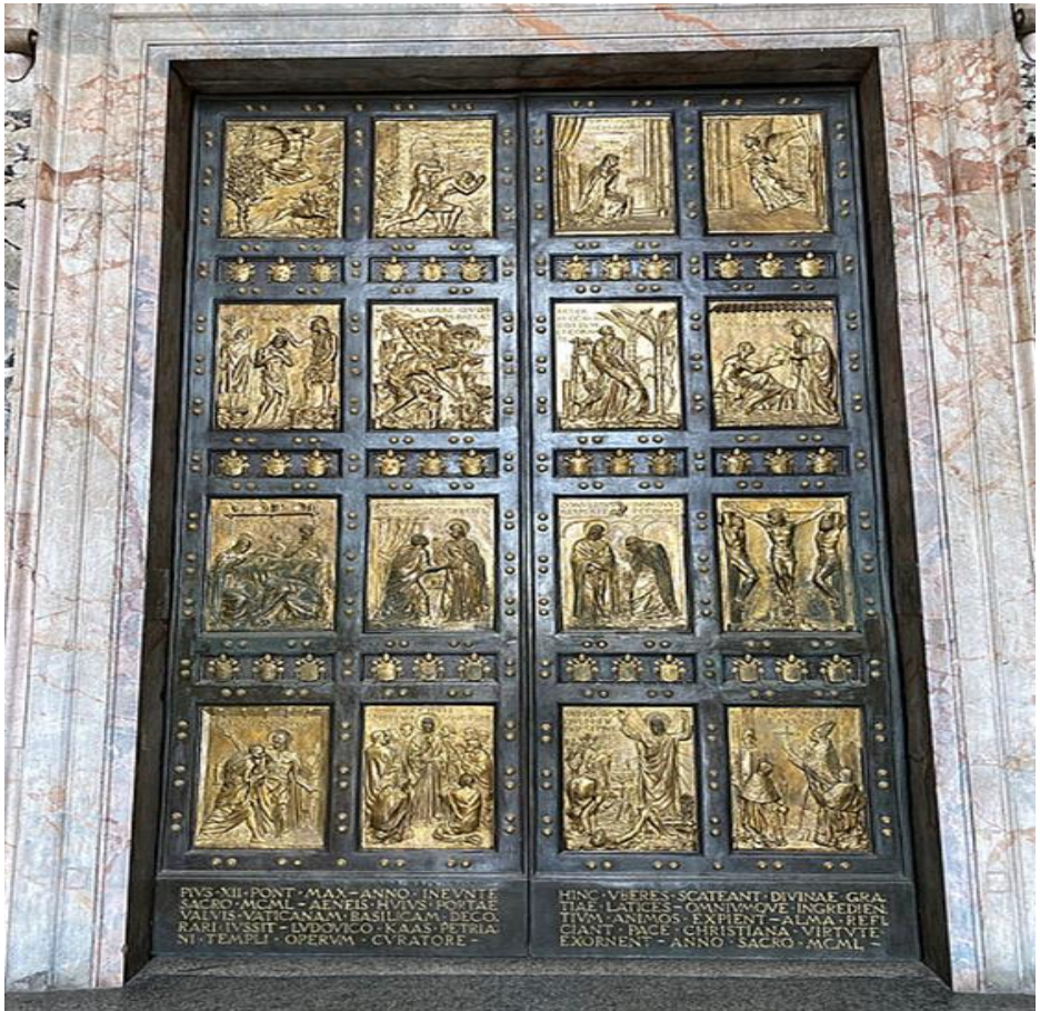
Petersdom: Die Heilige Pforte von außen